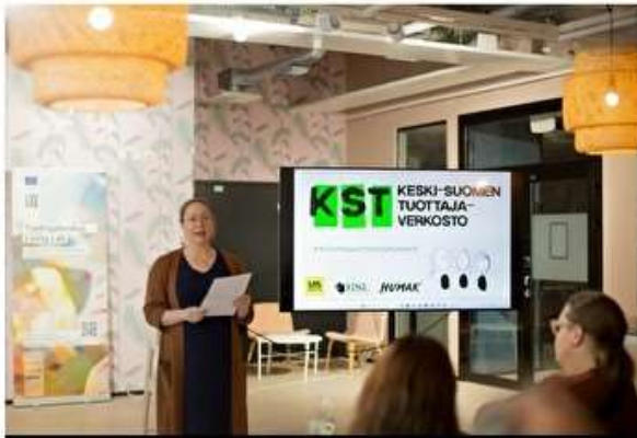
Kuvat: Utu Liimatainen