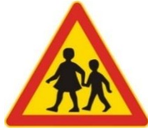
Varo lapsia! + 20 s