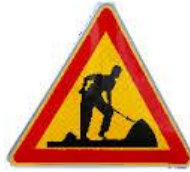
Tietyö + 25 s