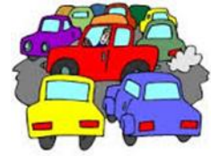
Liikenneuhka + 2 min 15