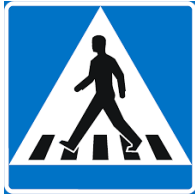
Suojatie + 15 s