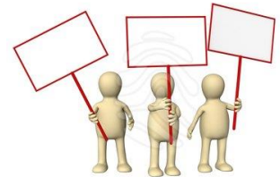
Mielenosoitus + 1 min