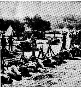
Brittiläisiä hyökkäysjoukkoja levähdystämällä Palestiinassa.