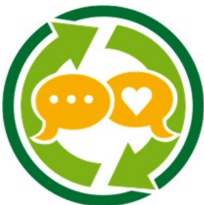
Tieto kiertoon -osaamismerkki

Tieto kiertoon voi rakentua mentorointisuhteelle tai vertaisoppimiselle ja kaiken ytimessä on oman osaamisen tunnistaminen ja tunnustaminen. Suhteessa voi myös pohjustaa omaa opinto- tai urapolkua ja oppia vaikkapa kiertotalouden uusista työnkuvista. Tieto kiertoon -toimintaan osallistuminen tunnustetaan ja osaaminen tunnustetaan digitaalisen osaamismerkkinä, jota voi opinnoissaan tai urallaan hyödyntää.