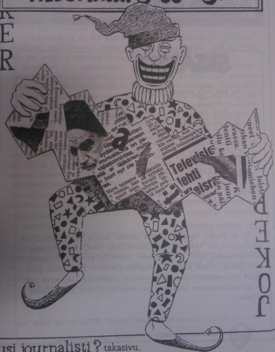
Uusi journalisti? takasivu.