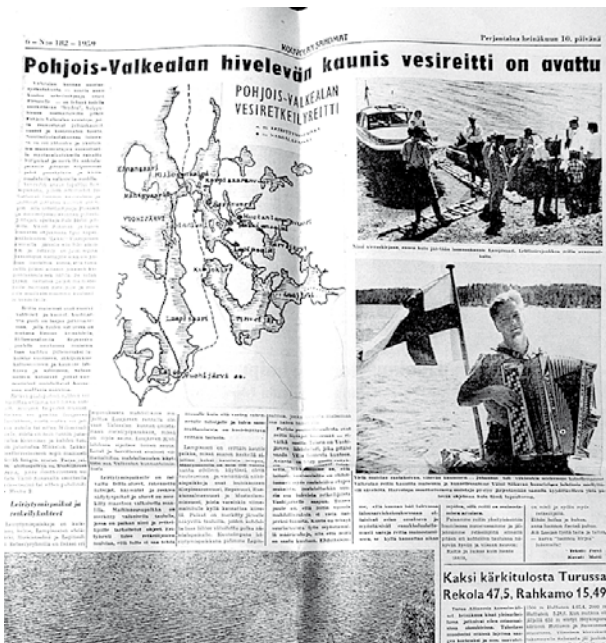
Kouvolan Sanomat kertoi 10.7.1959 kokosivun jutussa, että Pohjois-Valkealan vesiretkelyreitti on avattu.

Sen sijaan julkisuutta tuli pari vuotta myöhemmin järjestetyistä Pohjoismaisten suurlähettiläiden vierailuista Kultareitille, puhumattakaan 70-luvun lopulla alkaneista presidenttievierailuista Orilammella. Siitä enemmän ensi viikolla.