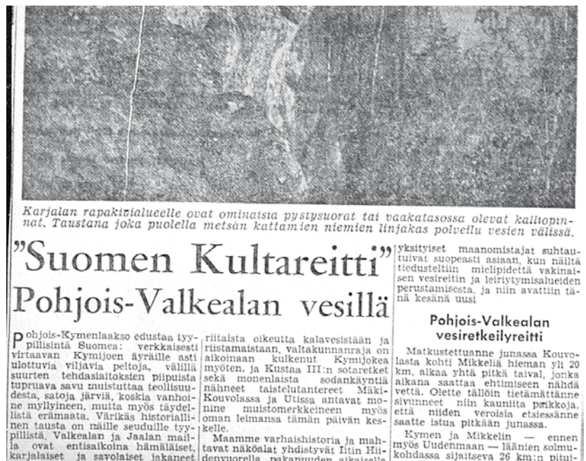
Kansallisen julkisuuden nimi sai Uudessa Suomessa syyskuun 10. päivänä 1959.